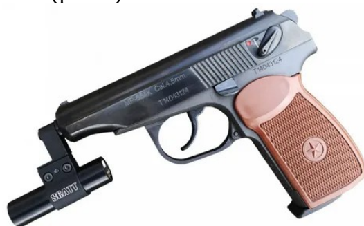
Рис. 1. Стрелковый тренажер «СКАТТ»

При обучении слушателей в ФКУ ДПО Кировский ИПКР ФСИН России по дисциплине «Огневая подготовка» активно используется стрелковый тренажер «СКАТТ». Данный комплекс является обучающим устройством, предназначенным для формирования, совершенствования и контроля профессиональных навыков у стреляющего. Современные стрелковые тренажерные комплексы, помимо имитации специфики управления системами, способны воспроизводить нештатные ситуации, такие как аварии и опасные режимы. Для работы с тренажером «СКАТТ» обучающийся закрепляет на оружии датчик, который с высокой точностью отслеживает движения оружия относительно мишени (рис. 1).