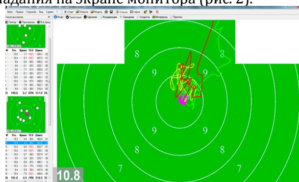
Рис. 2. Программа «СКАТТ»

Конструкция тренажеров «СКАТТ» базируется на методе определения координат с использованием инфракрасного излучателя, интегрированного в электронную мишень, и инфракрасного приемника, установленного на оружии. Информация от приемника (сенсора) передается в вычислительный модуль тренажера, где она преобразуется для дальнейшей отправки на персональный компьютер. Получив эти данные, компьютер обрабатывает их с помощью программы «СКАТТ», которая визуализирует траекторию прицеливания и место попадания на экране монитора (рис. 2).