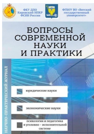
Рис. 2. Обложка сетевого научно-практического издания института

По состоянию на 01.01.2026 было издано тринадцать выпусков (таблица 1) сетевого издания – электронного научно-практического журнала «Вопросы современной науки и практики» (рис. 2).